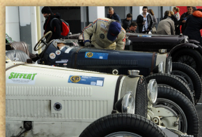
CLASSIC DAYS 2019 – CIRCUIT DU MANS BUGATTI