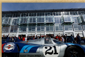
6 & 7 juillet

Pour compléter le spectacle sur piste, les Classic Days c'est aussi des animations, des activités tout au long du week-end : rallye touristique, exposition de véhicules, démonstrations de F1, protos, Avant-Guerre, village marchand ... et bien sûr la grande parade Autosur Classic !