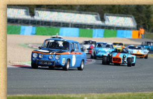
1 / 4