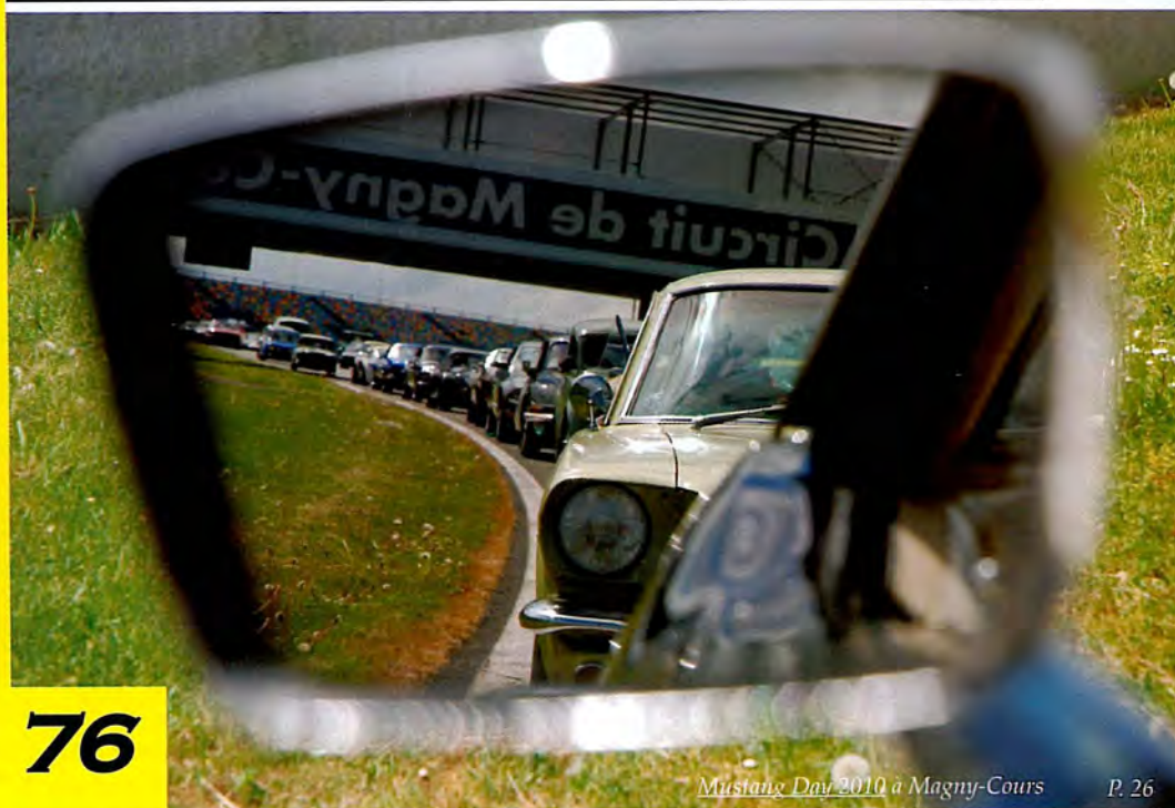
Mustang Day 2010 à Magny-Cours P. 26