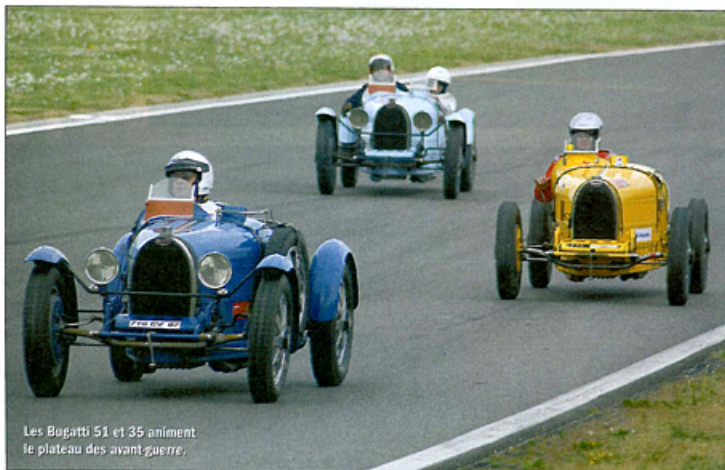
Les Bugatti 51 et 35 animent le plateau des avant-guerre.

Bien avant les Classic Days, les Ford Galaxy participaient aux courses de "stock car" aux USA. On les a même vues, en France, au Tour de France automobile de 1963.