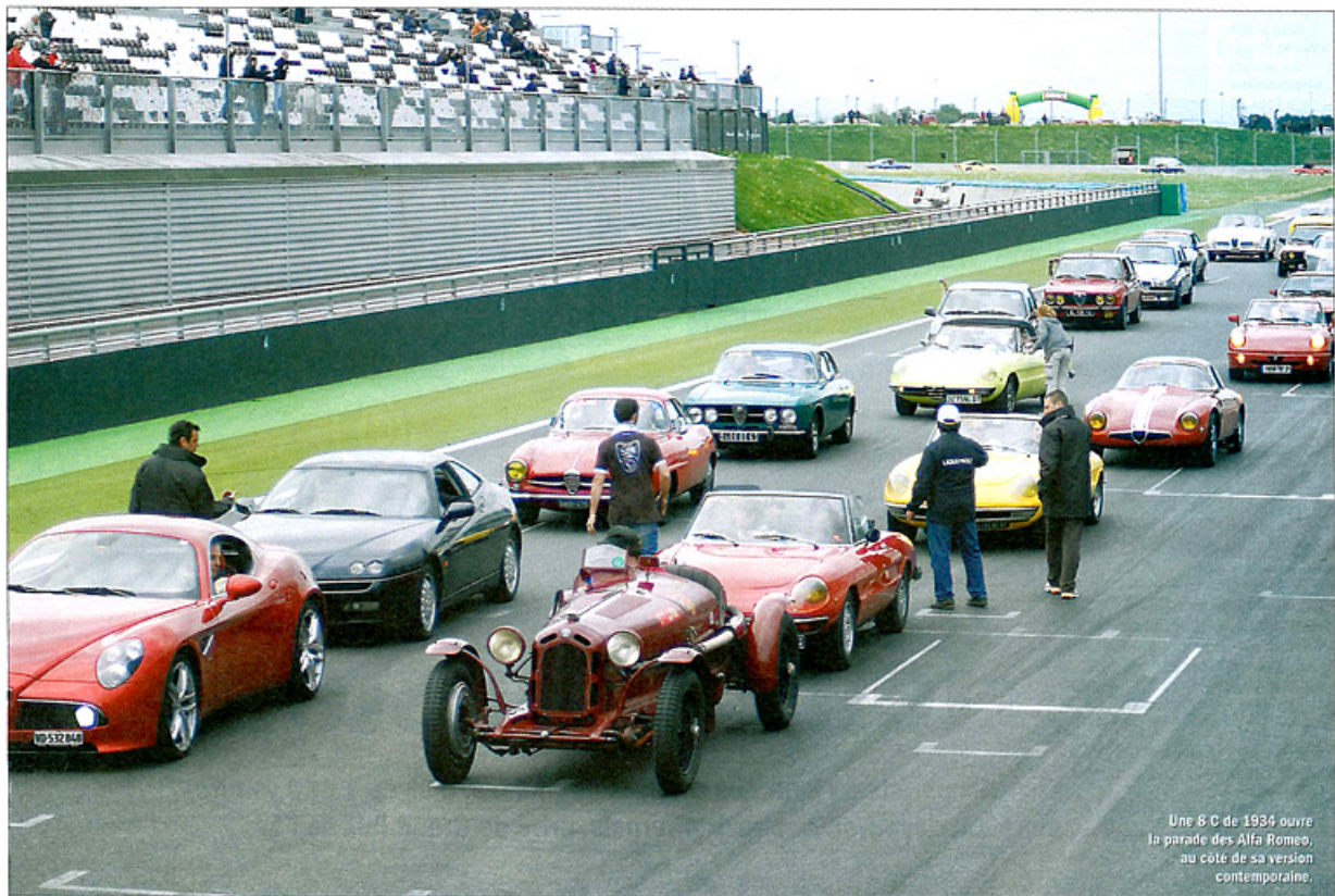
Une 8C de 1934 ouvre la parade des Alfa Romeo, au côté de sa version contemporaine.

Avec le millésime 1967, la calandre de la Mustang subit un léger "restylage".